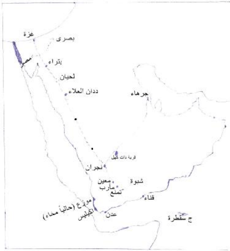
خريطة توضح طريق القوافل التجارية البرية النصف الثاني من الألف الأول قبل الميلاد